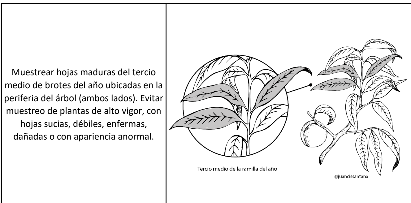
Figura 1: Protocolo de muestreo en duraznero y nectarino, hojas achuradas son las que se deben seleccionar.